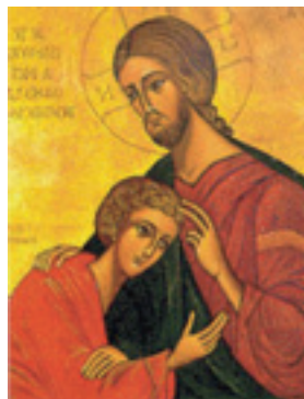
Disciplen Johannes ved Jesu bryst (jf. Joh. 21,20) Kilde: "Voces y rostros del Evangelio", Teatinos en Mexico , nr. 32 (2006), (jf. www.teatino.com/mexico/imagenes/revista/anteriores/32 )