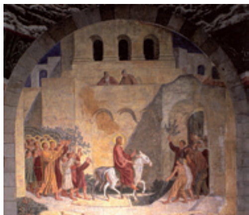
Jesu indtog i Jerusalem palmesøndag Ved at ride ind i Jerusalem på et æselføl palmesøndag afslørede Jesus sin sande identitet som den forjættede messias (109). Dette freskomaleri er udført af Joakim Skovgaard i Viborg Domkirke.

Jesus åbenbarede først på et sent tidspunkt af sit liv sin sande identitet for disciplene (fx Joh. 13,13 og Mar. 8,29ff)(jf. Joh. 4,25f), og han pålagde dem samtidig strengt ikke at fortælle omverdenen derom (fx Matt. 16,20 og Mar. 8,30). – Da han blev klar over, at korsfæstelsens time var nær, og at hans mission derfor stod umiddelbart foran sin fuldendelse (fx Joh. 17,1-4), besluttede han at afsløre sin sande identitet ved palmesøndag at ride ind i Jerusalem på et æselføl (Matt. 21.1ff) (Luk. 19,28 ff)(Joh. 12,12ff). Martinus har sagt, at denne brug af et æselføl egentlig var Jesus imod, og at han udelukkende gjorde det for dermed at