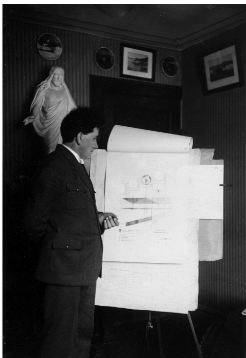
År 1928 förklarar Martinus symbol nr 86, Människans utvecklingsanalys. Jordklotets utvecklingssteg . Se förklaring i Storkursen st. 201.

Vid en markering av Sakens 50-årsdag på institutet den 24 mars 1971 talar Martinus också över det viktiga temat att lida orätt: ”Vi är pionjärer för denna nya världsepok. Det är vår uppgift att sätta den till världen. Varje människa som lär känna analyserna, har fått sig anförtrodd en uppgift som är den största en människa över huvud taget kan få. Man kan inte få en större uppgift än att förklara Guds tillstånd, förklara de kosmiska analyserna och lära människorna hur man ska vara kärleksfull inför alla och förstå att det inte finns någon som kan lida orätt, och ingen kan göra orätt” ( Kosmos nr 4/2010).